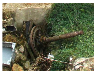
Prensa de puente