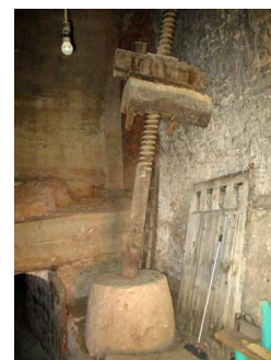
Husillo y pilón