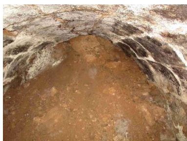
Pila del mosto

Es posible que se conserven las trazas de la pila de la uva, a la que se accede a través de una trampilla metálica. La pila del mosto es subterránea, y se encuentra a mitad del cañón de bajada a la bodega. En la nave principal de la bodega se observa la canilla de piedra, que comunica con la pila del mosto.