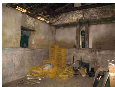
Pila, cargadero y portajón

Se observan los dos portajones de descarga de la uva, uno en cada fachada. Las guías de la viga situadas bajo el cargadero son de una única pieza.