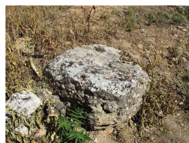
Base de la cárcel