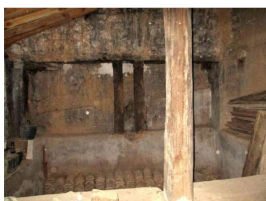
Pila y cargadero