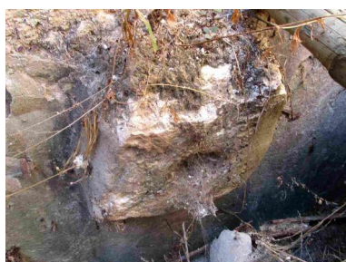
Canilla de piedra