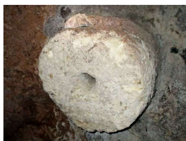
Canilla (en bodega 27)