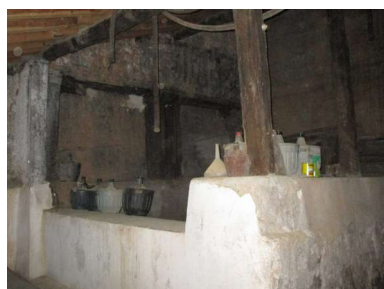
Pila de la uva

Se conserva la totalidad de elementos del lagar, salvo la viga, de la que queda un pequeño tramo junto al husillo. Las guías de la viga situadas bajo el cargadero son de una única pieza.